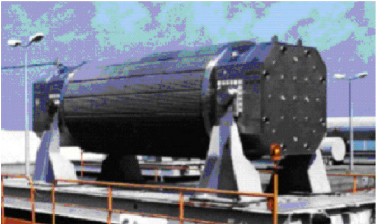
Foto 1 Vista del contenitore di trasporto

I trasporti del combustibile di Caorso sono effettuati con i contenitori denominati TN17-2 (vedi Foto 1) e messi a disposizione dalla TN International (azienda specializzata nei trasporti internazionali del gruppo Areva). Tali contenitori (di massa complessiva di circa 80 tonnellate) sono conformi agli standard IAEA per il trasporto di materiale radioattivo e sono stati approvati sia dalla Competente Autorità Francese sia da quella Italiana (APAT) e sono progettati per trasportare fino a 17 elementi di combustibile di tipo BWR (biossido di uranio arricchito (UO 2 )).