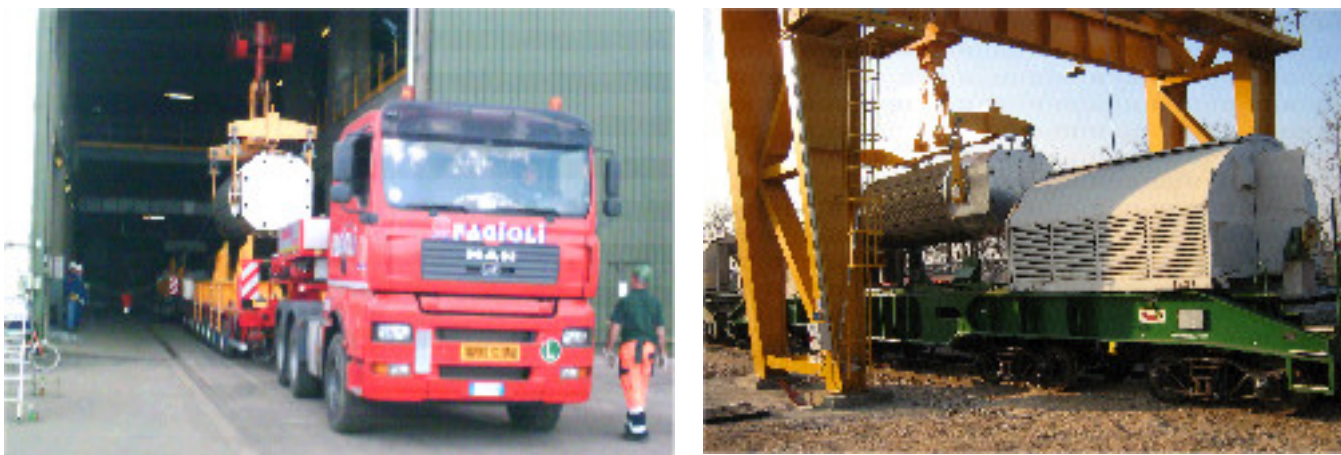
Foto 2 Operazioni di movimentazione (trasferimento contenitore su carrello stradale e su vagone ferroviario) eseguite presso la centrale nucleare e la stazione ferroviaria di Caorso.

Il raccordo ferroviario di Caorso adibito a sito di trasferimento (transfer point) è stato realizzato dalla Sogin, che ha acquisito l'asset dello scalo ferroviario della stazione ferroviaria di Caorso, modificandolo ed attrezzandolo secondo uno specifico progetto approvato da RFI e presentato all'APAT, sotto la cui vigilanza saranno effettuate tutte le operazioni di movimentazione (vedi Foto 2).