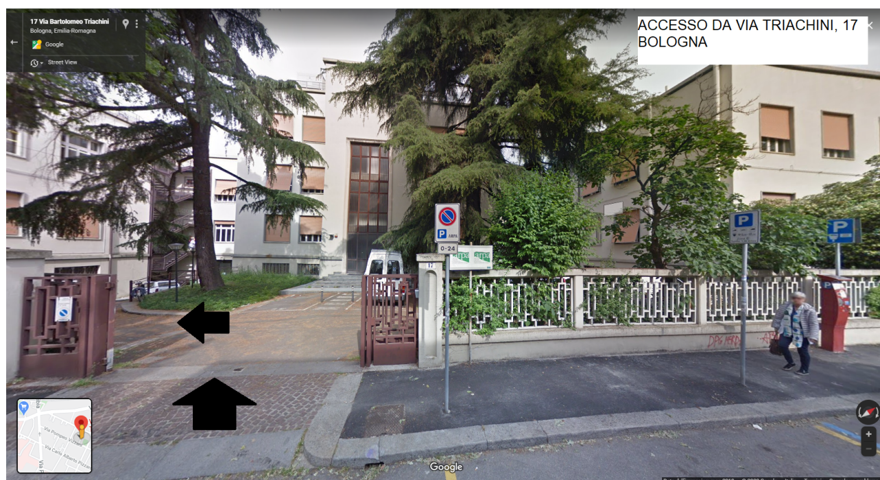
Ingresso Arpae da via Triachini, 17 Bologna

L'accesso dei candidati avverrà da via Triachini, 17 . I candidati varcato il cancello dovranno, come da cartellonistica presente in loco e da elaborato grafico annesso al presente documento, percorrere la rampa di sinistra per circa 50 m fino a giungere alla porta di ingresso dove sarà presente un banco per il riconoscimento.