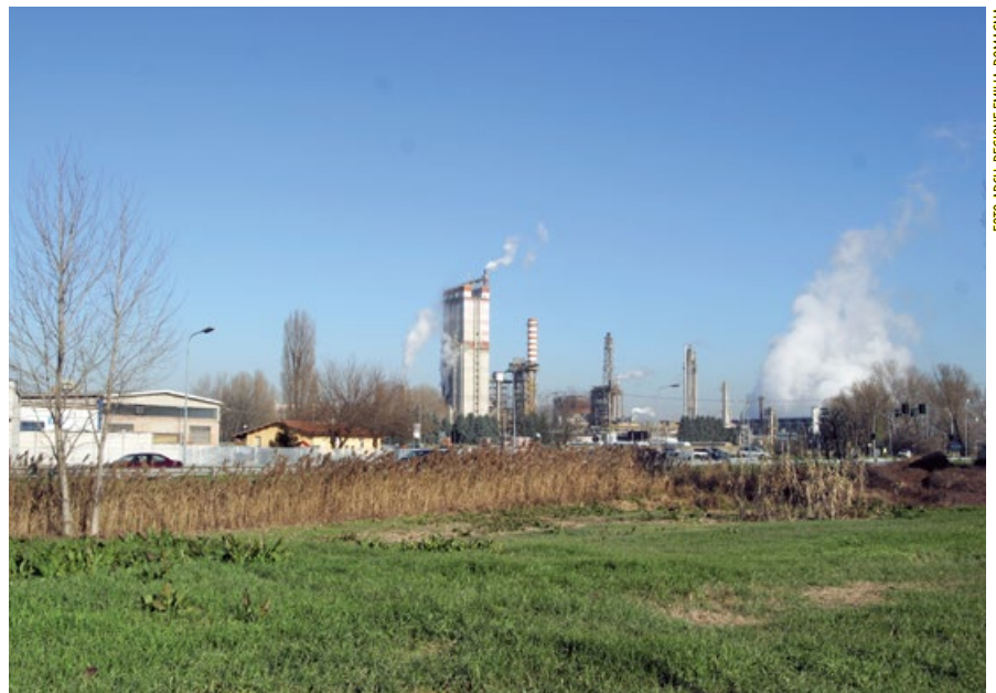
FOTOGRAFIA REGIONE EMILIA-ROMAGNA

In particolare Emas con 142 imprese registrate, mantiene la maggiore diffusione nelle province di Parma (39) e di Bologna (28). Il settore predominante è quello dei Servizi per la gestione e trattamento dei rifiuti che continua a crescere grazie a grandi holding che operano sul territorio, resta stazionario il settore Alimentare, mentre perde sempre più terreno la pubblica amministrazione. La diretta concorrente ISO 14001 passa