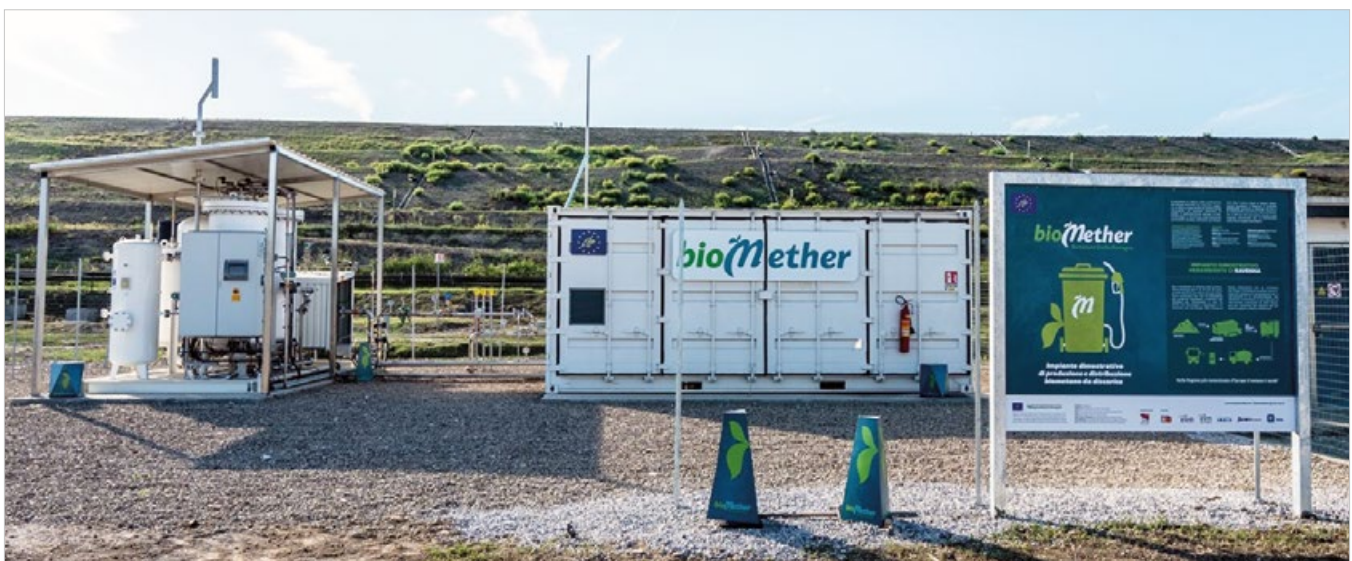
FIG. 4 IMPIANTO DI RAVENNA Impianto sperimentale di biometano del progetto Biomether presso la discarica di Ravenna.