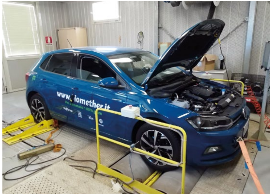
FIG. 3 TEST BANCO A RULLI DI ENEA Demovettura Biomether alimentata esclusivamente a biometano durante la prove a Casaccia (Roma).

In Emilia-Romagna (dicembre 2022) sono operativi 8 impianti di biometano ( tabella 1 ), 3 da sottoprodotti agroindustriali e agricoli e 5 da Forsu, per una produzione annua totale