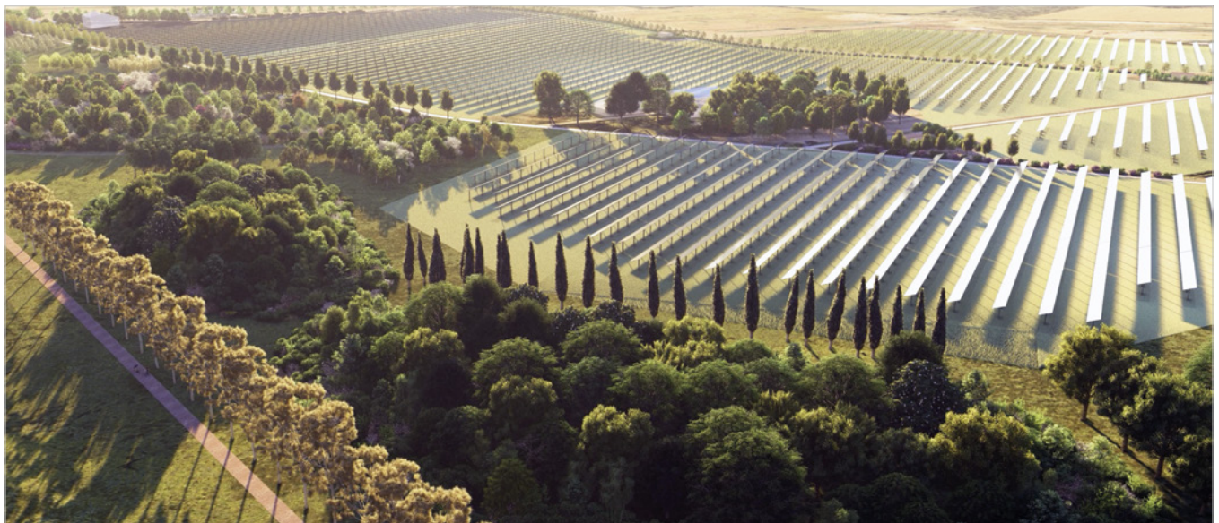
RENDERING ENERGY PARK PAENZA. IMMAGINE MEMORA SAS

guida Ispra/Snpa 28/2020, specificando contenuti minimi, metodologie e modalità operative per la valutazione ambientale di tali impianti. Le linee guida rappresentano uno strumento di semplificazione e razionalizzazione del processo autorizzativo, in quanto individuano in modo chiaro e univoco il set minimo di contenuti tecnici imprescindibili per la redazione dei Sia, favorendo la presentazione di studi completi e coerenti e contribuendo, di conseguenza, alla riduzione delle integrazioni istruttorie, delle prescrizioni ambientali e alla complessiva velocizzazione dell'iter autorizzativo. Le linee guida adottano un impianto metodologico uniforme che, per ciascuna delle dieci tematiche ambientali da analizzare nei Sia, prevede l'analisi, a diverse scale territoriali (area vasta e area di sito 1 ) e supportata da dati, indicatori ed elaborati cartografici, delle potenziali interferenze fra opera e ambiente. Nel dettaglio, il Sia deve far emergere come gli obiettivi perseguiti con la realizzazione dell'opera, la localizzazione dell'impianto e le soluzioni progettuali scelte siano coerenti con la normativa nazionale e regionale, con il contesto