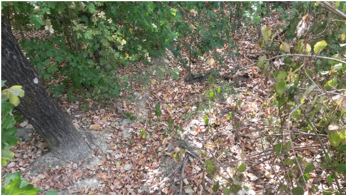
Alveo Rio Rondinella