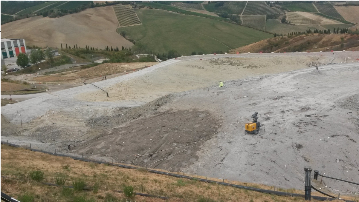
Vista area di abbancamento rifiuti interessata da incendio del 12/08/17

Agenzia regionale per la prevenzione, l'ambiente e l'energia dell'Emilia-Romagna