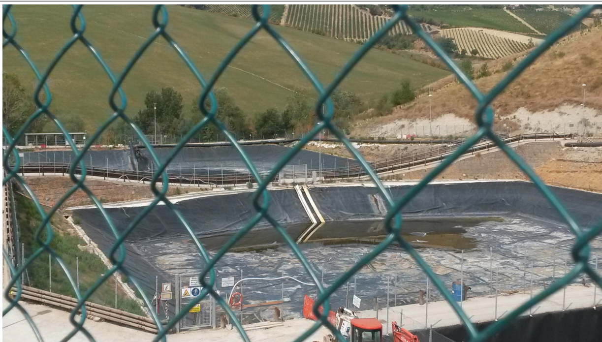
Vista vasca V3 con residuo di acque meteoriche

Agenzia regionale per la prevenzione, l'ambiente e l'energia dell'Emilia-Romagna