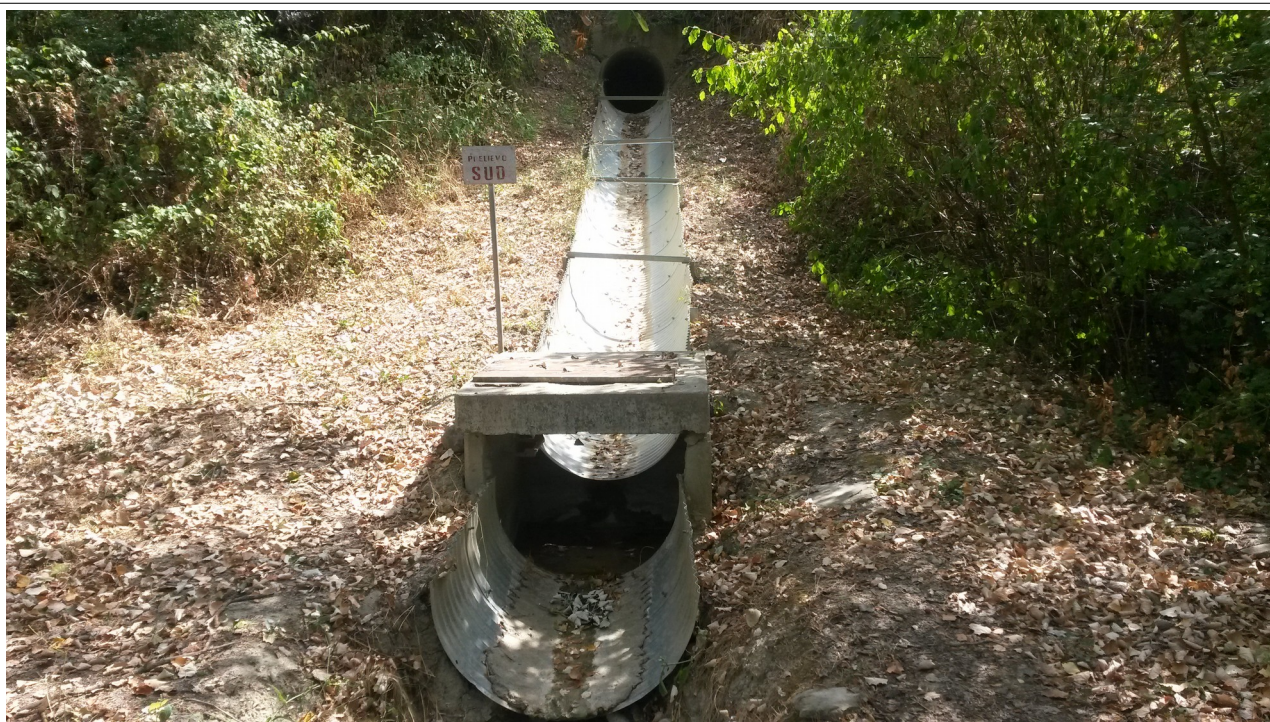
Vista Canala Sud