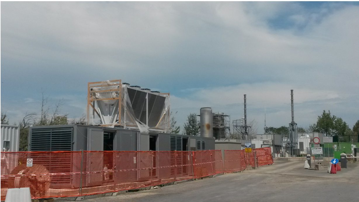
Cantiere installazione nuova centrale di aspirazione e nuovo motore per recupero energetico Biogas