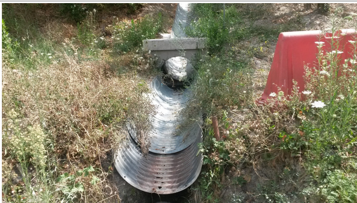
Vista Canala Nord

Agenzia regionale per la prevenzione, l'ambiente e l'energia dell'Emilia-Romagna