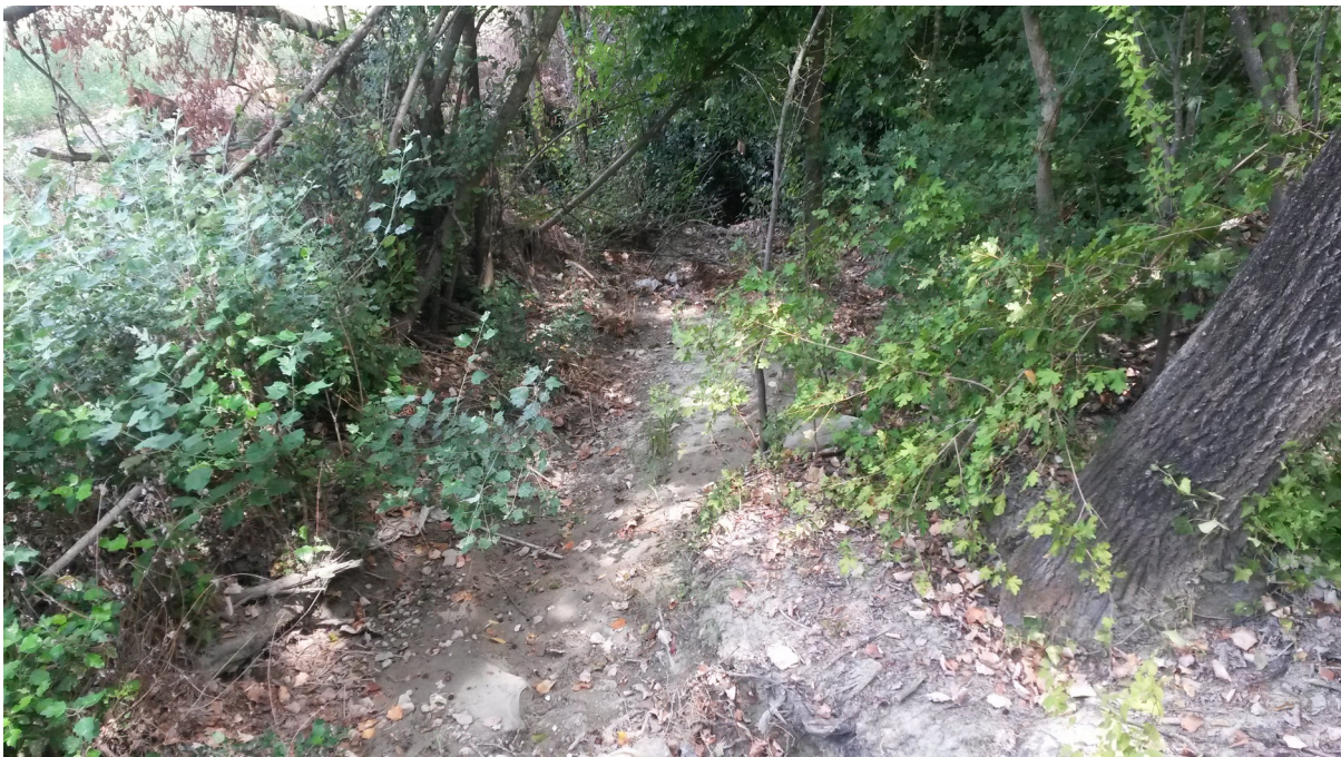
Alveo Rio Rondinella

Agenzia regionale per la prevenzione, l'ambiente e l'energia dell'Emilia-Romagna