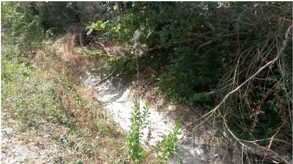
Alveo Rio Rondinella

Agenzia regionale per la prevenzione, l'ambiente e l'energia dell'Emilia-Romagna