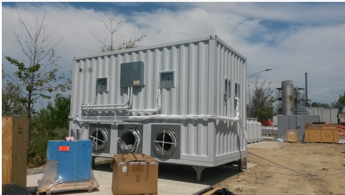
Cantiere installazione nuova centrale di aspirazione e nuovo motore per recupero energetico Biogas

Agenzia regionale per la prevenzione, l'ambiente e l'energia dell'Emilia-Romagna