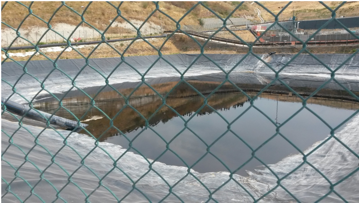
Vista vasca V4 con percolato