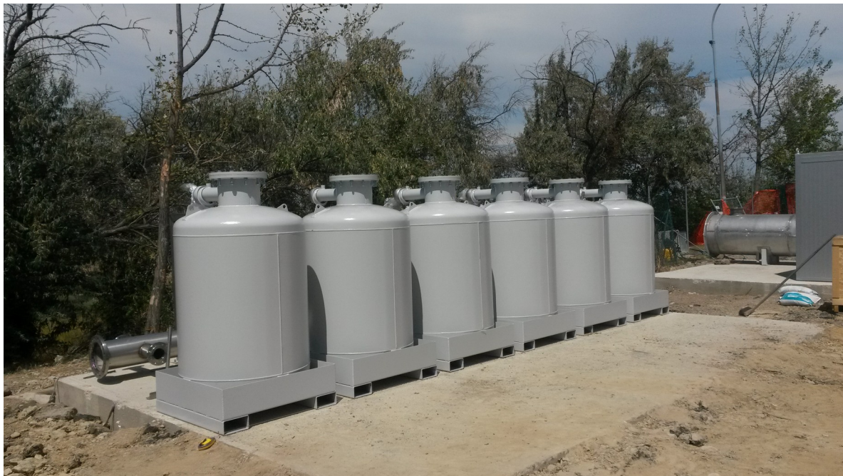
Cantiere installazione nuova centrale di aspirazione e nuovo motore per recupero energetico Biogas

Agenzia regionale per la prevenzione, l'ambiente e l'energia dell'Emilia-Romagna