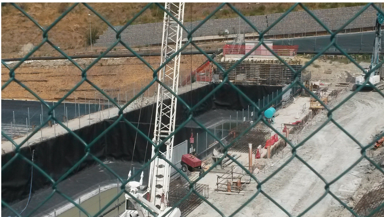
Cantiere rimozione vasche V1 e V2: attività ferme