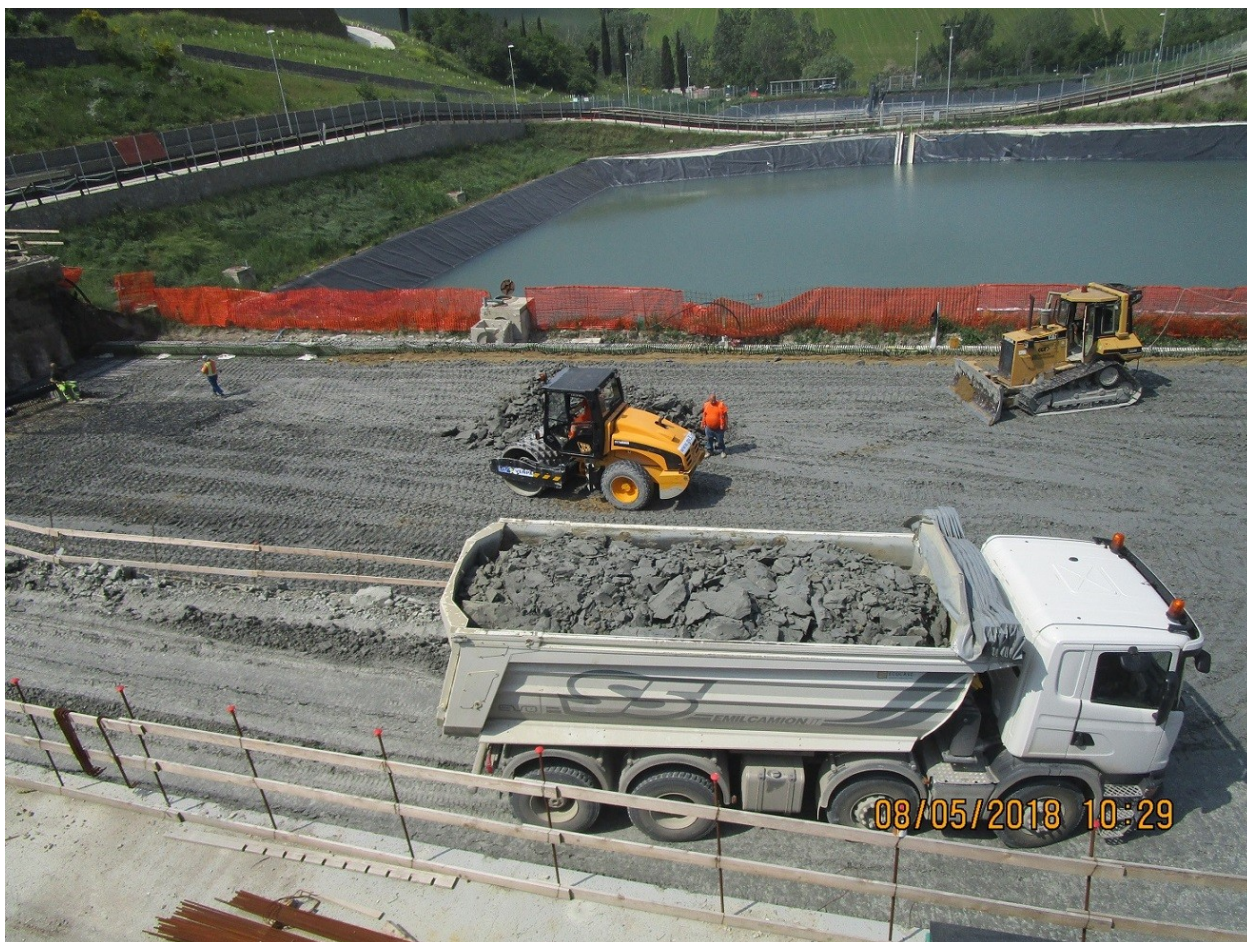
Foto n.2: 08/05/18 – Vista area cantiere ex vasche V1 e V2. Arrivo camion con argilla