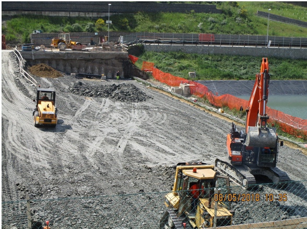
Foto n.3: 08/05/18 – Vista area cantiere ex vasche V1 e V2 in fase di riempimento con argilla