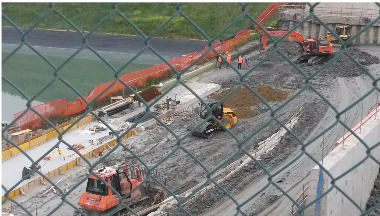
Foto n.1: 03/05/18 – Vista area cantiere ex vasche V1 e V2 in fase di riempimento con argilla