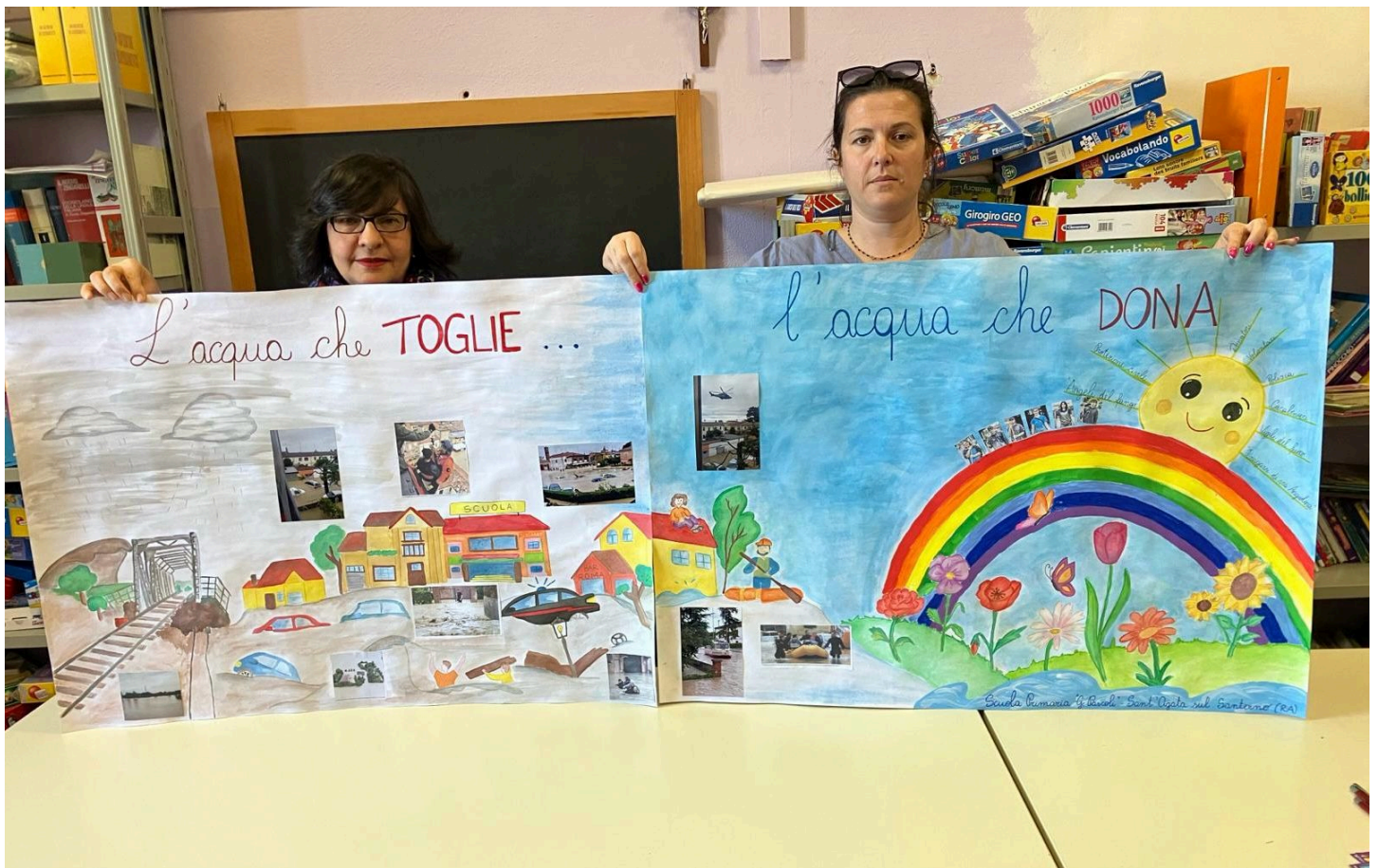
I disegni della Scuola primaria "G.Pascoli" Sant'Agata sul Santerno (Ravenna)

"UNICEF ha diffuso questo importante messaggio nelle scuole, al fine di istruire bambini e ragazzi sull'importanza di conoscere l'acqua per salvaguardarla come bene prezioso, ma anche per prevenirne o limitarne i danni. Pensiamo, per esempio, all'alluvione in Emilia-Romagna del maggio 2023, che ha provocato disastri ed emergenze non ancora risolte. Siamo soddisfatti e felici di aver ricevuto una così ampia partecipazione da parte delle scolaresche e invitiamo tutti i cittadini all'inaugurazione della mostra perché dai bambini possiamo imparare messaggi importanti".