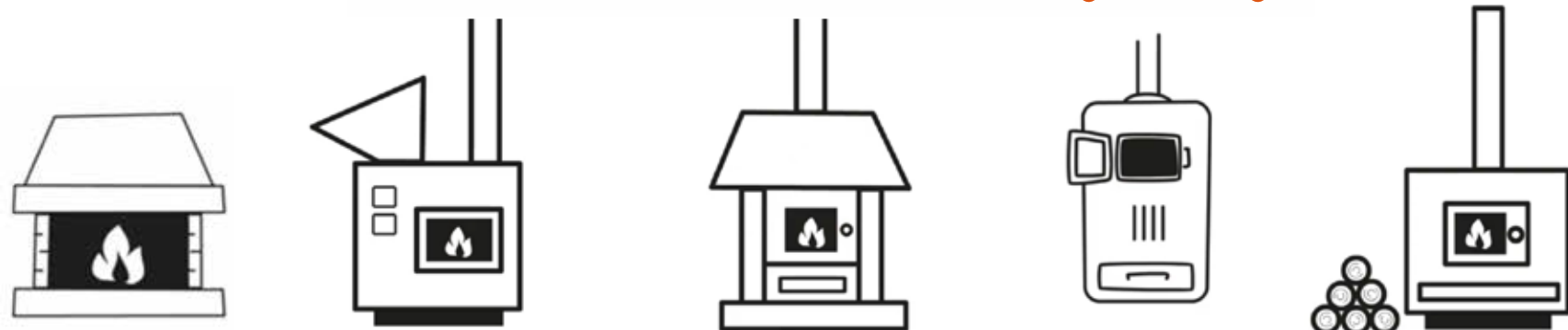
CAMINETTI APERTI, CAMINI CHIUSI, STUFE, INSERTI E CUCINE A LEGNA O PELLETTI, CALDAIE ALIMENTATE A PELLETTI O CIPPATO