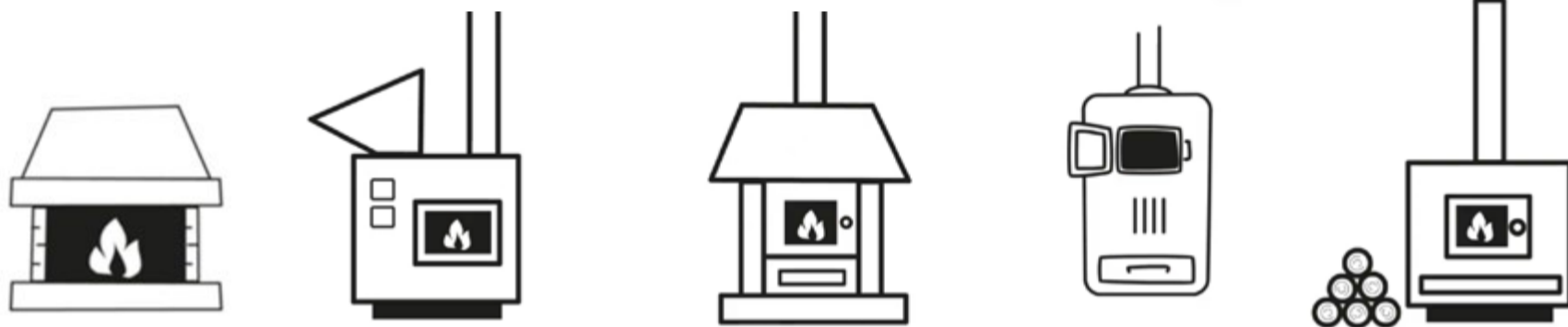
CAMINETTI APERTI, CAMINI CHIUSI, STUFE, INSERTI E CUCINE A LEGNA O PELLETT, CALDAIE ALIMENTATE A PELLETT O CIPPATO