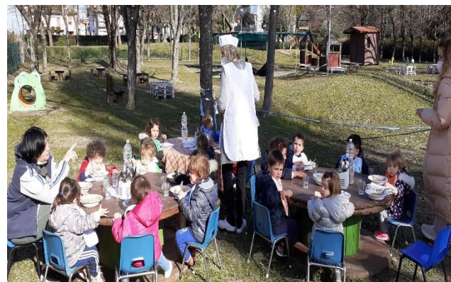
Nido Vigne Parco